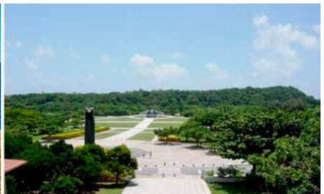
2018年の摩文仁が丘（平和祈念公園）