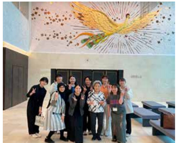
国際平和ミュージアムでのイベント終了後、被爆者の方を囲んで。

被爆地の外で核兵器の話をするための切り口を見つけることは容易なことではないかもしれませんが。それでも多くの人が希求する「平和」のために何ができるのかという課題を共有しながら、「平和」のために核兵器は必要なのだろうか、どうして核兵器は無くならないのだろうかなどの問いを立て、目の前の一人ひとりとの丁寧な対話が、核兵器をなくすための鍵になってくると思います。考え方が違うように思える相手とでも、相手と自分との共通項を見出し、その共通項を軸に対話することを諦めず続けていきたいと考えています。