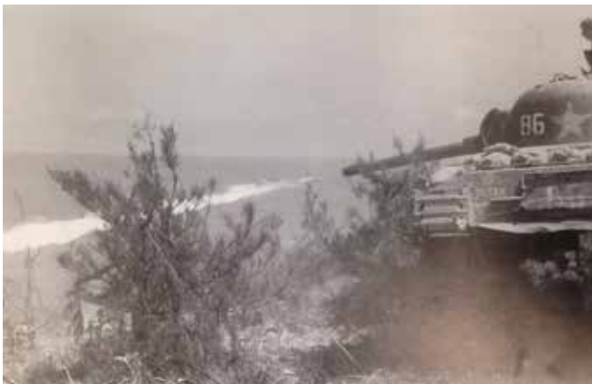
米軍の火炎放射器

戻った翌日だったと思います。野戦病院から連絡が来ました。その丘の近くのたくさんの防空壕が敵の火炎放射でやられた、もうここにはおれないので、野戦病院は移動します、皆さんもどこかへ逃げてください、という連絡なのです。やっと入れてもらった防空壕があるのだからここにいる、とは言えません。火炎放射というのは艦砲射撃のように軍艦から打ち込んでくるわけでもな