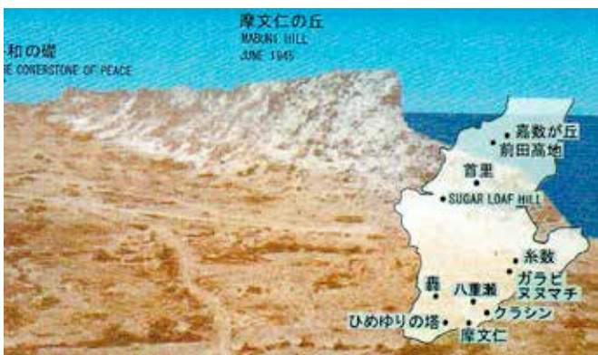
1945年当時の摩文仁が丘

でも恐ろしい状況が着々と進んでいます。沖縄の南の与那国、石垣、宮古で着々と軍備が進められています。防衛という名の下に標的にされることは必至です。戦争が起こらない状況を作っていくには、若い人たちが本当に本気で自分はこんな目に遭いたくない、戦争はやってはいけないということを自分ごととして考えることが非常に大事なことではないでしょうか。