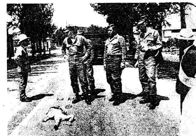
◆写真：嬉野京子 一九九五年四月、歳の少女が米軍車両によってひき殺された。米軍統治の期間中、日本の警察でさえも立ち入ることができず、事実上、被害者に対して補償されることなど全くありませんでした。そしてその問題は今も続いています。一九七二年から一九九五年までに、五二四九七件の交通事故が米軍人によって引き起こされました。これらのケースの多くで、被害者とその家族は正当な補償もされずに来ています。(写真：嬉野京子)

「私たちは何を共に出来るでしょう。そしてあなたがたは何が出来ますか」あなたがたはきっと、なぜ私たちがこのアピールを私たちが政府にではなくアメリカの人々に対して訴えるのかと疑問に思うかもしれません。私たちは、自国の政府の方針についても、活動を行ってきています。でも、この働きかけは太平洋の両側に対して必要なのです。これは日本の問題であると共にアメリカの問題でもあるのです。 1、クリントン政権の国防戦力見直し(QDR)が現在進行中です。議員に手紙を書いて、海兵隊の撤退を含む在日米軍の撤退を支持するように求めてください。2、あなたの意見や考えを手紙、FAXまたは電子メールでお寄せください。 今日、私たちは沖縄の米軍基地の七五%を占めている海兵隊の撤退を求めています。私たちの願いは軍事を使わないで、市民の連帯によって、日米の真の友好関係を築くことです。私たちはあなた方が沖縄と日本からの海兵隊の撤退