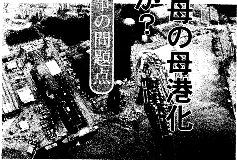
右側の空母が停泊しているのが問題の12号バース