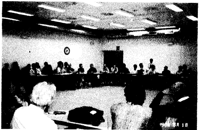
Abolition2000年会(Ouvriere大学・ジュネーブ)

核兵器国との間だけでなく、カナダやニュージーランド、またいくつかのEU諸国を含めた非核兵器国のほとんどに失望をもたらし、具体的な合意に向けた道を塞いだといえよう。