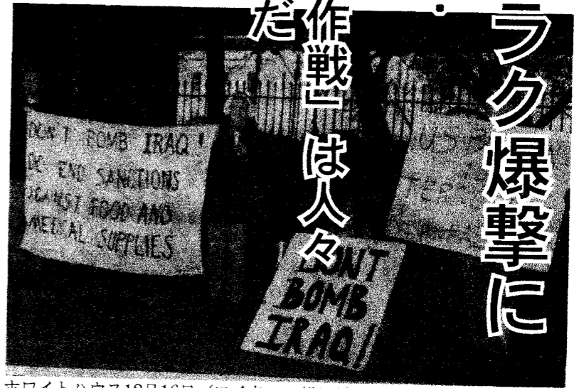
ホワイトハウス12月16日 (ロイター・朝日新聞)

湾岸戦争の悪夢が再現されている。12月十七日未明、米英の爆撃機と艦船から発射されたミサイルがバクダッド市民を襲った。第一派の攻撃で少なくとも五名の犠牲者が出たと伝えられている(十七日「朝日」夕刊)。