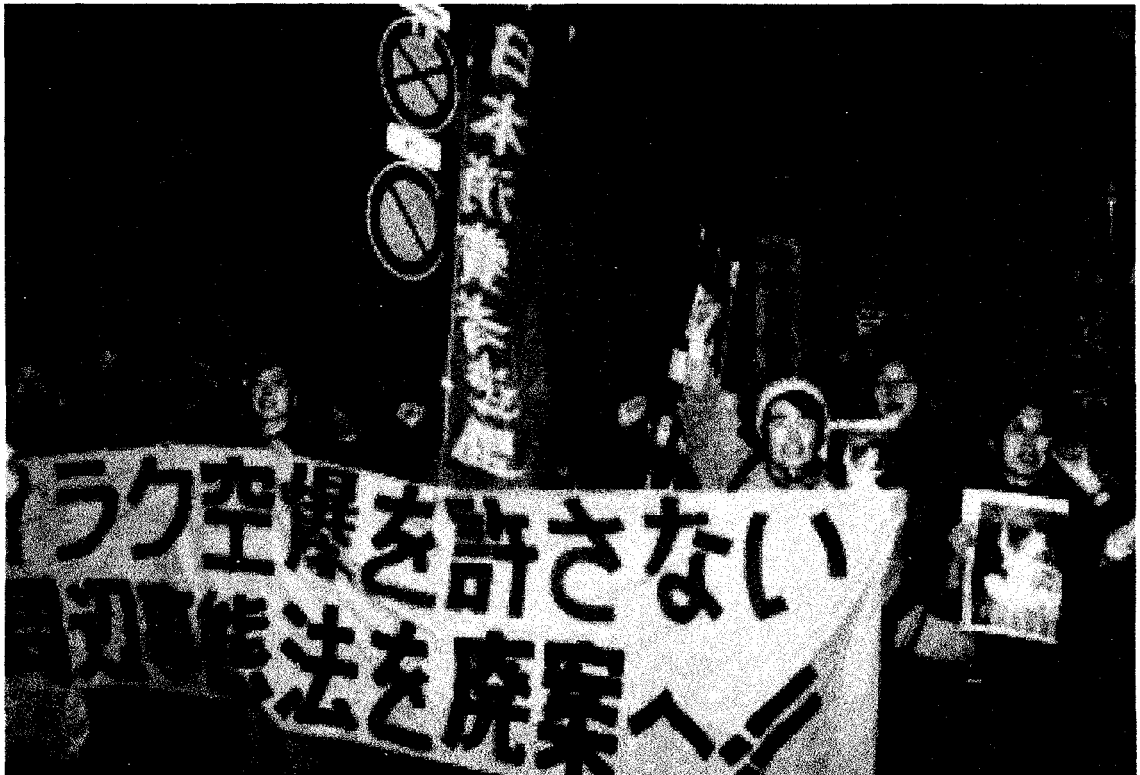
米英のイラク空爆に抗議のデモ (12.21・東京) : 写真 今井明

自衛隊の海外派兵を食い止め、大規模軍縮を！ 米軍基地を撤去しよう！ 反核運動を継続し、核廃絶を！ 憲法9条を世界に！ 市民による平和政策を提起しよう！ 草の根の国際共同作業を進めよう！