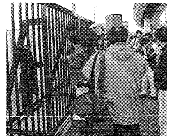
3月28日地方総監に抗議文を手渡す。

海上自衛隊自衛艦隊司令の「海上警備行動」の発令と、横須賀地方総監部の関連法案の成立発言に、かさねて抗議します。