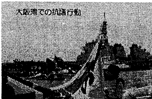
大阪湾での抗議行動

ピースリンクの仲間は呉基地の正面ゲートで申入れを行い、平和船団を出して海上からの抗議行動を行った。