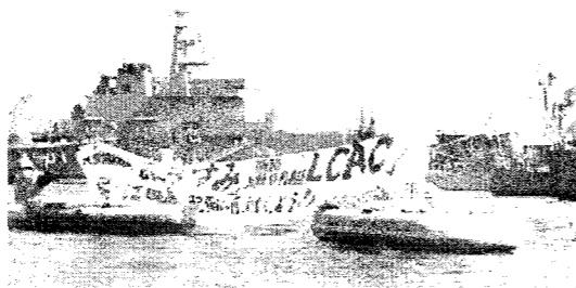
98.3 「おおすみ」の呉配備に抗議する平和船団

今後、全ての個別演習が、そうした位置づけの元で進められていく可能性を示唆している。そうであれば、個別演習に対する組織的な行動を意識的に準備していかなければならないだろう。この点を、皆で共有したことは大きな意義があった。◆◆