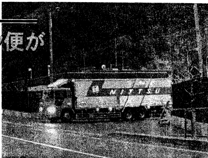
呉市の広弾薬庫から弾薬を積んで出発する民間トラック

1月10日から25日にかけて、呉市内の米陸軍広弾薬庫から、長崎県佐世保市の米海軍針尾弾薬庫に向けて毎日のように弾薬のトラック輸送がくり返された。今回、佐世保からの話があり、広を出るトラックの監視活動を行い、まぎれもなくそれらのトラックが佐世保に到着することを確認した。