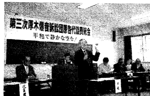
住民は三度目の訴訟を起こしたたかっている。

この発言を巡って、爆同を初め、各自治体も猛反発、以後NLPが終了してからも抗議行動が続いた。29日には基地正門前で抗議集会も開催、米海軍厚木基地司令官宛の爆同など3団体の申し入れを行った(申入書は次ページ)。