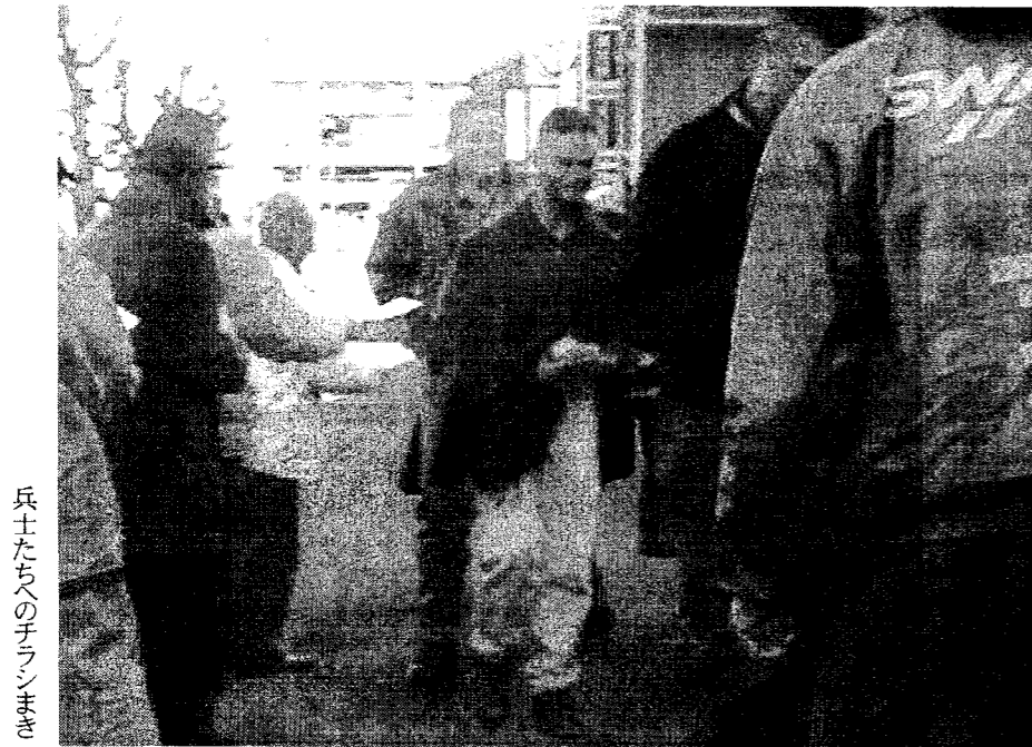
兵士たちのチャリまき

彼ら自身の尊厳や人権がそこで踏みにじられているからこそ、そのような形で吹き出でしまい、ある時には他の人の尊厳や人権を踏みにじる形になってしまうのではないかと感じた。しかし、だからと言って、このよう (次ページ下段へ)