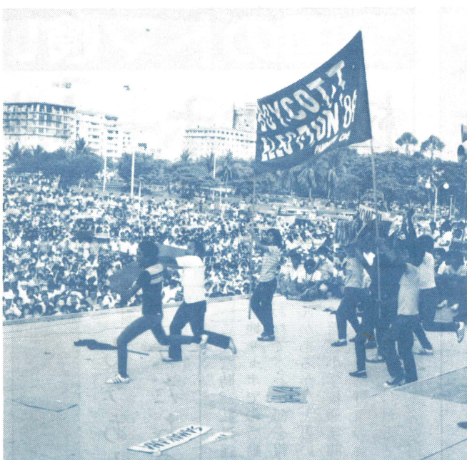
反マルコス闘争が歴史的な局面を迎えているフィリピンに編集委員の一人が二週間滞在する機会を得たので一文を寄せてもらった。(写真はマニラ市ルネタ競技場のボイコットのための五万人集会、5月13日)

のスローガン幕・10メートル四方もある絵が掲げられている。そこへ五月四日にスタートしたサカバヤン(選挙ボイコット運動のため