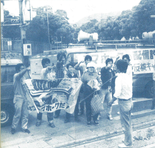
佐世保米軍基地前での抗議行動(5月13日、キャラバン隊)