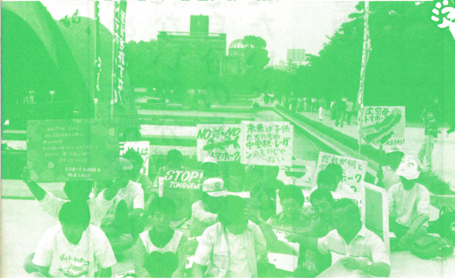
原爆記念碑の前に座る反トマホーク・キャラバン隊(5月19日、広島)