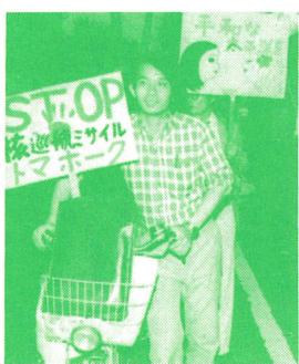
お仕事の帰りのデモのひと

《ええじゃないかコール》 トマホークないほうがええじゃないか！軍拡やめたらええじゃないか！核はなくせばええじゃないか！