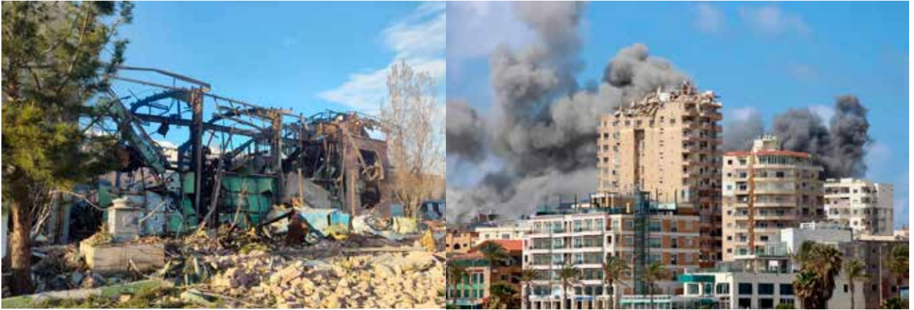
左：2026年4月4日の米軍による爆撃で壊滅的被害を受けたテヘランのシャヒード・ベヘシュティ大学